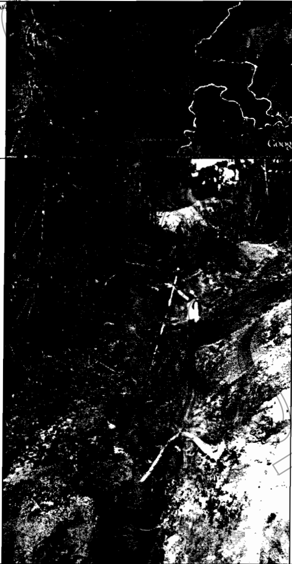
Trocha que se abrió sobre bosque natural.