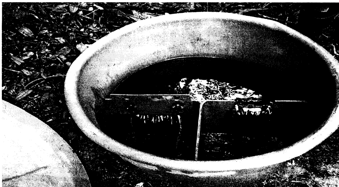
Figura 1. Tanque de control de caudal