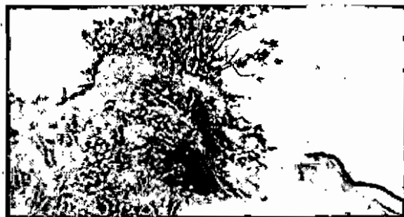
Imagen 3. Taludes donde se encuentran ubicados los árboles

Además, la remoción de los mismos se hace necesaria, para continuar con la adecuación de taludes que fue aprobado por la Secretaría de Minas del Departamento de Antioquia, en el Plan de Trabajos e Inversiones (PTI).