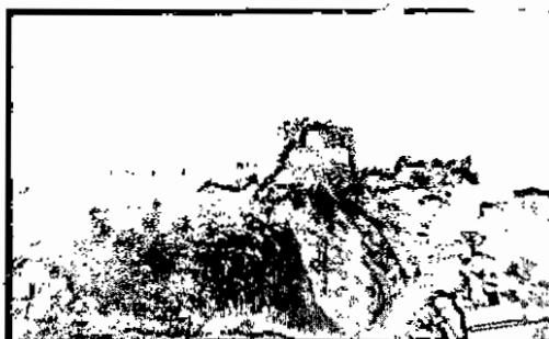
Imagen 2. Panorámica de la ubicación de los árboles

Además, las altas pendientes en donde se encuentran los árboles objeto de aprovechamiento, se están inclinando hacia la pendiente, lo cual a su vez incrementa el riesgo de volcamiento de los mismos.