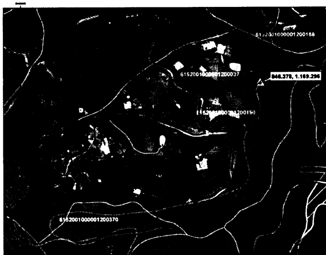
Ubicación del predio de la intervención