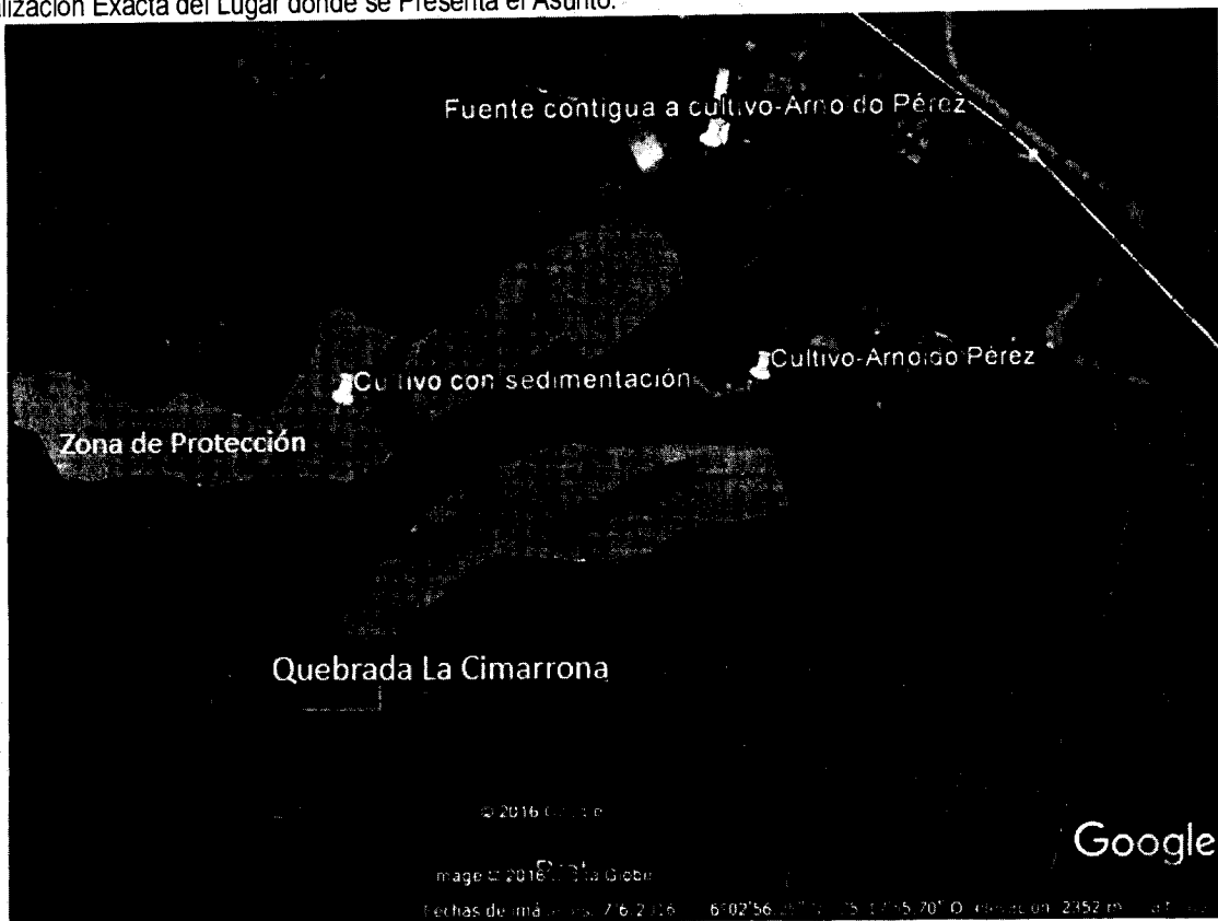
Figura 1. Localización del sitio