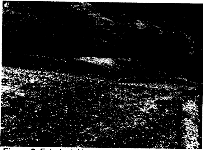
Figura 2. Estado del terreno-predio del señor Ramón Pérez