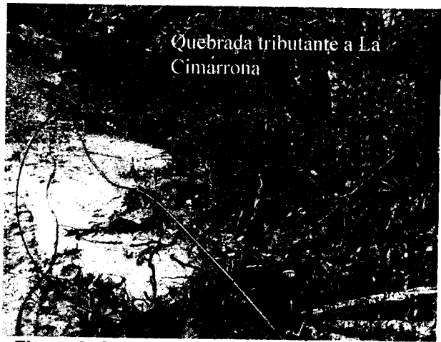
Figura 3. Sedimentación contigua a la quebrada La Cimarrona

El certificado de uso del suelo del predio visitado informa que éste corresponde a Zona de protección y zona de regulación hídrica; teniendo en cuenta el Sistema de Información Geográfica de la Corporación, se expone en la Figura 4 la zonificación que presenta el predio, evidenciando zonas identificadas como zonas de protección, contenidas en el Acuerdo 250 de 2011 de Cornare, por el cual se establecen determinantes ambientales para efectos de la ordenación del territorio en la subregión de Valles de San Nicolás.